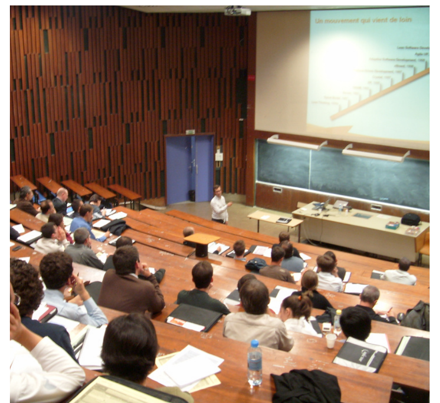
Une photo collector de cette première édition d'Agile Grenoble

Il a fallu "défendre" le buffet contre les étudiants qui passaient dans les locaux. Les portes des amphis grinçaient très forts et cela a un peu perturbé les orateurs lorsque des personnes en retard arrivaient. Les quelques sponsors étaient sur une mezzanine, super serrés et peu visibles. C'est d'ailleurs une des raisons qui m'a poussé à proposer à l'équipe d'orga que l'on prenne d'autres locaux "plus professionnels" en 2009, quitte à faire payer 20 euros l'entrée pour financer ces locaux (une partie d'Alpexpo), et ce qui nous a fait sortir de la coordination de l'Agile Tour dont nous sommes sortis en 2010.